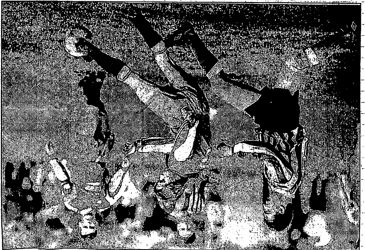
Uwe Felgenträger wechselt vom TV Askania Bemburg zum BSC Blendorf.