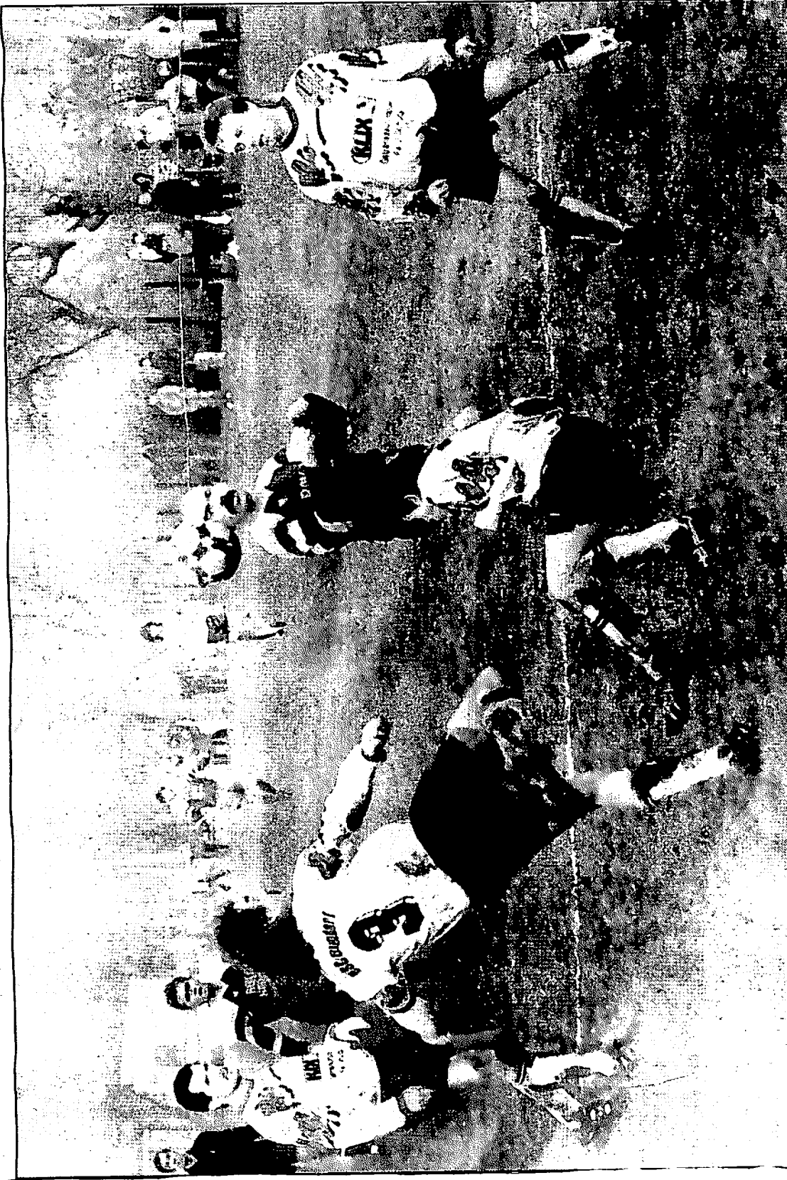
In dieser Situation waren die Biendorfer personell überlegen, am Ende hatten aber die Plötzkauser das bessere Ende für sich.