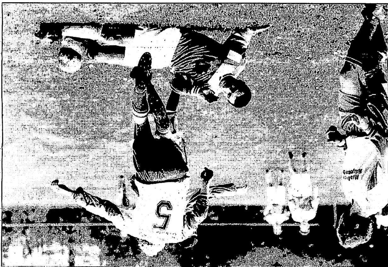
Im Kreisderby lieb Biendorf dem VfB Neugattersleben keine Chance.