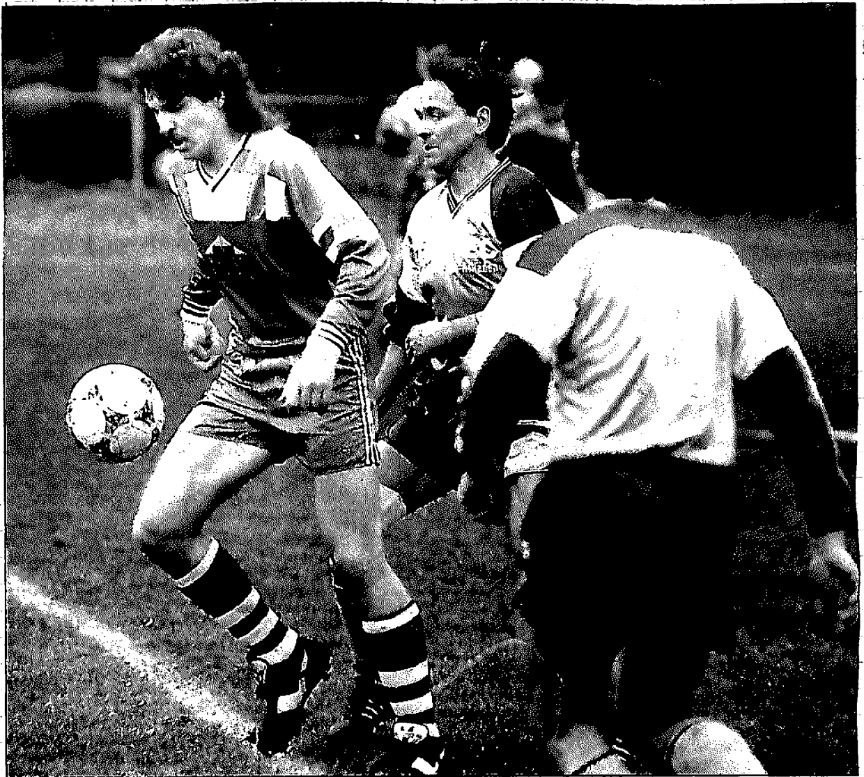
Blendorf und Könnern; hier eine Szene aus dem vorangegangenen Derby, treffen am vorletzten Punktspieltag noch einmal aufeinander.