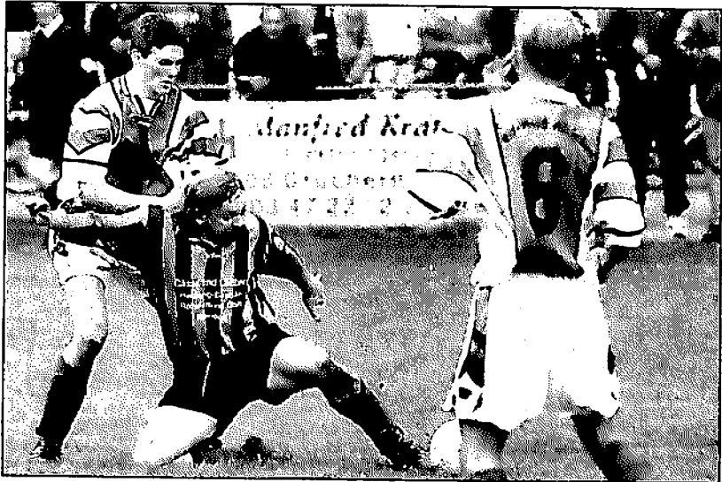
Der Biendorfer Freitag will den Ball behaupten.

Die Gäste waren von diesem Rückstand wenig beeindruckt und setzten die Biendorfer unter Druck. Die Partie wurde in der Folge etwas zu hart aber nicht unfair geführt, wobei der Unparteiische ab und an seine Entscheidungen zu Gunsten des BSC und daher sehr zum Mißfallen der Alslebener Bank entschied. Dann gab es zwei Großchancen für die Platzbesitzer nach genau einer halben Stunde. Zunächst brachte