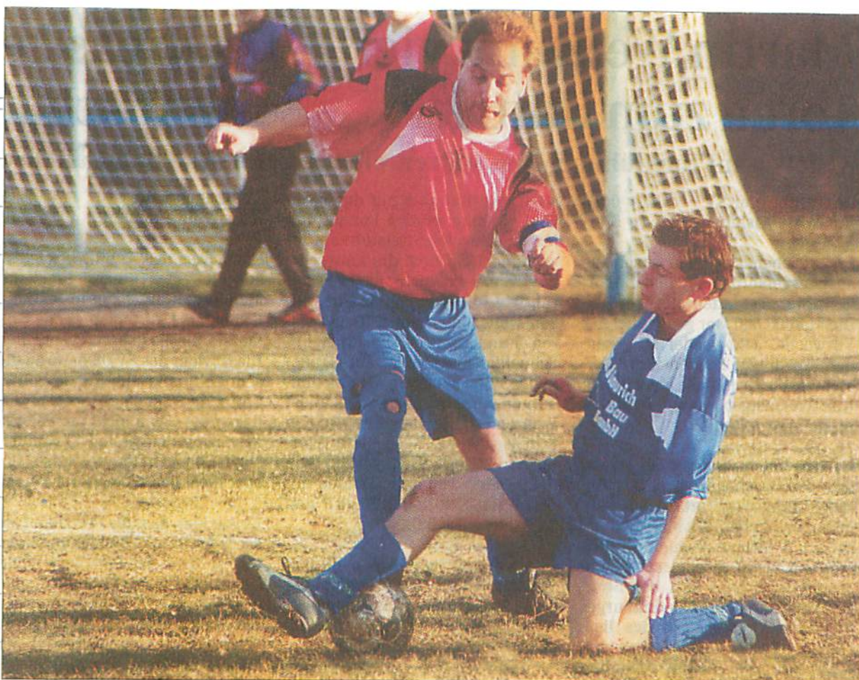
In der zweiten Kreisklasse trennten sich am Sonnabend die beiden Reserve-Mannschaften des gastgebenden TSV und des BSC Biendorf 3:2.