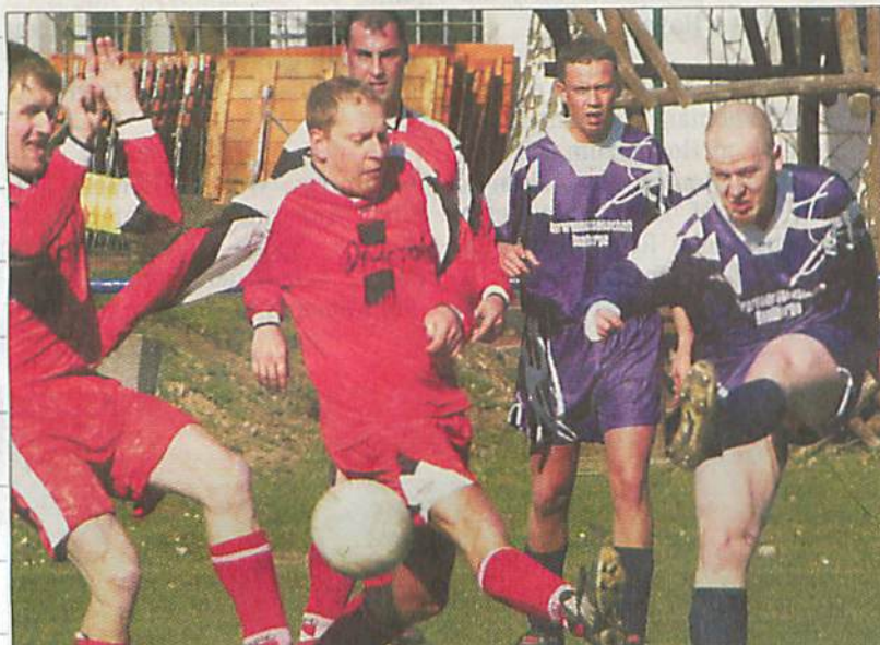
Der SV 08 Baalberge II kassierte gegen den Vorletzten Wohlsdorf eine 2:3 Heimpleite und bleibt damit weiter in der abstiegsgefährdeten Zone.