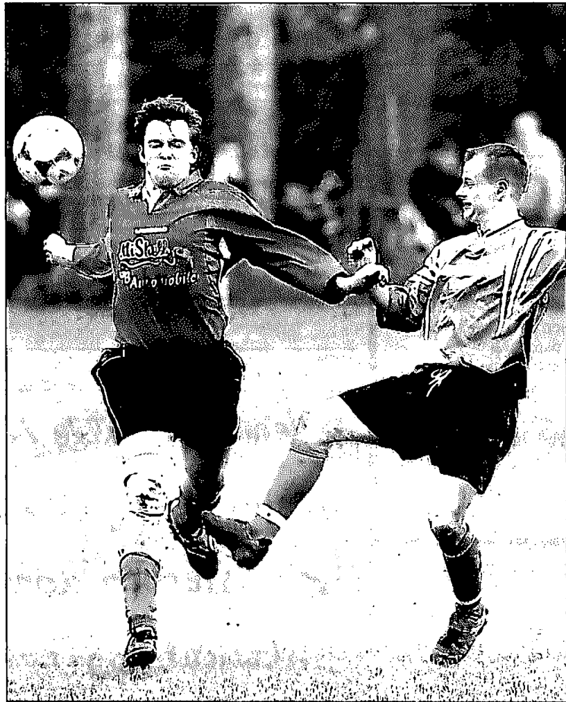
Mit seinem 3:2-Erfolg gegen Verfolger Schwarz-Gelb Bernburg bleibt der BSC Biendorf auf Meisterkurs in der Fußball-Kreisliga.

Biendorf - Schwarz-Gelb 3:2 (1:0) Es war auf dem nassen Platz ein eher kampfbetontes Spiel, das in der ersten Hälfte ausgeglichen war. Nach dem Anschlusstreffer zum 3:2 wurden die Roschwitzer Gäste stärker, liefen aber in die Konter der Biendorfer, ohne zu einem eigenen Torerfolg zu kommen. Bei 460 zah-