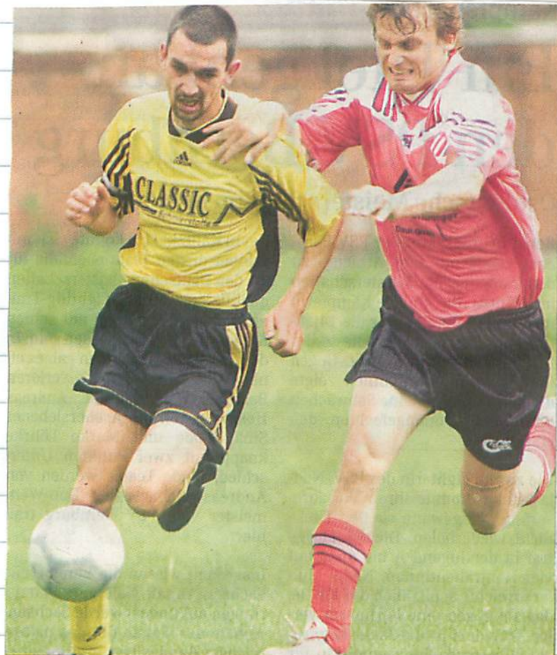
Die in gelb-schwarz spielenden Ilberstedter konnten den Heimvorteil im „Endspiel“ um Rang drei gegen Schackstedt nicht nutzen.

Letzter Spieltag, 25. Mai/18 Uhr: Preußnitz - Gröna, Gerbitz - Einheit, Plötzkau II - Güsten, Biendorf - Neuborna, Askania II - Könnern, Schackstedt - Schw.-Gelb, Nienburg II - Ilberstedt