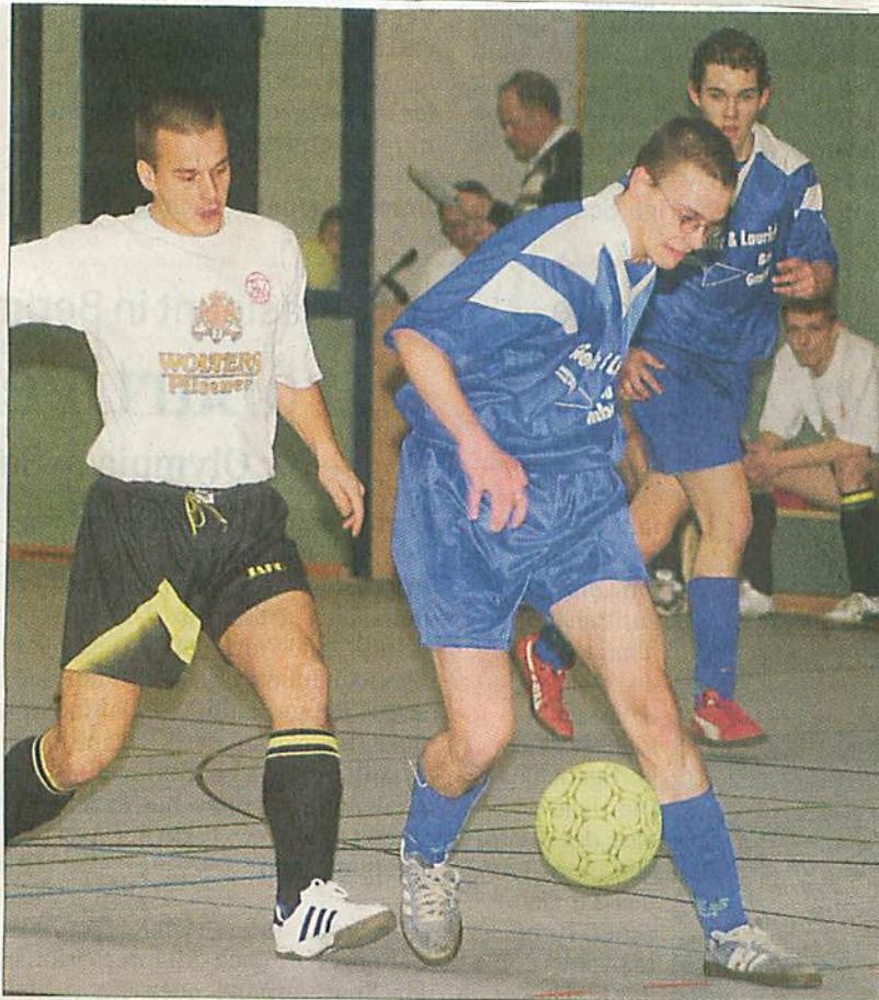
Dröbel führte gegen Biendorf II schon 4:1, dann kamen die Biendorfer noch zum Anschlusstreffer.

Titelverteidiger SV Einheit Bernburg II und der Vorjahresfinalist SG Neuborna-Freizeit spielen dabei in verschiedenen Staffeln. Neben Neuborna spielen der FSV RW Alsleben II, Altenburger SG und der VfL Ilberstedt II in der Gruppe A. In der Gruppe B spielen Einheit II, der SV Fichte Latdorf, SV RS Edlau und TuS Bebitz.