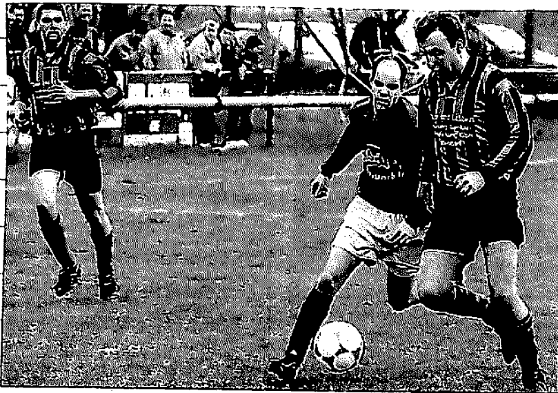
Die Kreisliga-Fußballer des BSC Biendorf dürfen sich berechnete Hoffnungen auf den Aufstieg machen.

Nur wenn es gelingt, die mannschaftliche Geschlossenheit beizubehalten und spieltaktisch reifer zu agieren, ist in diesem Spieljahr ein Platz unter den ersten Drei möglich - es wäre wieder eine Steigerung nach zwei vierten Plätzen.