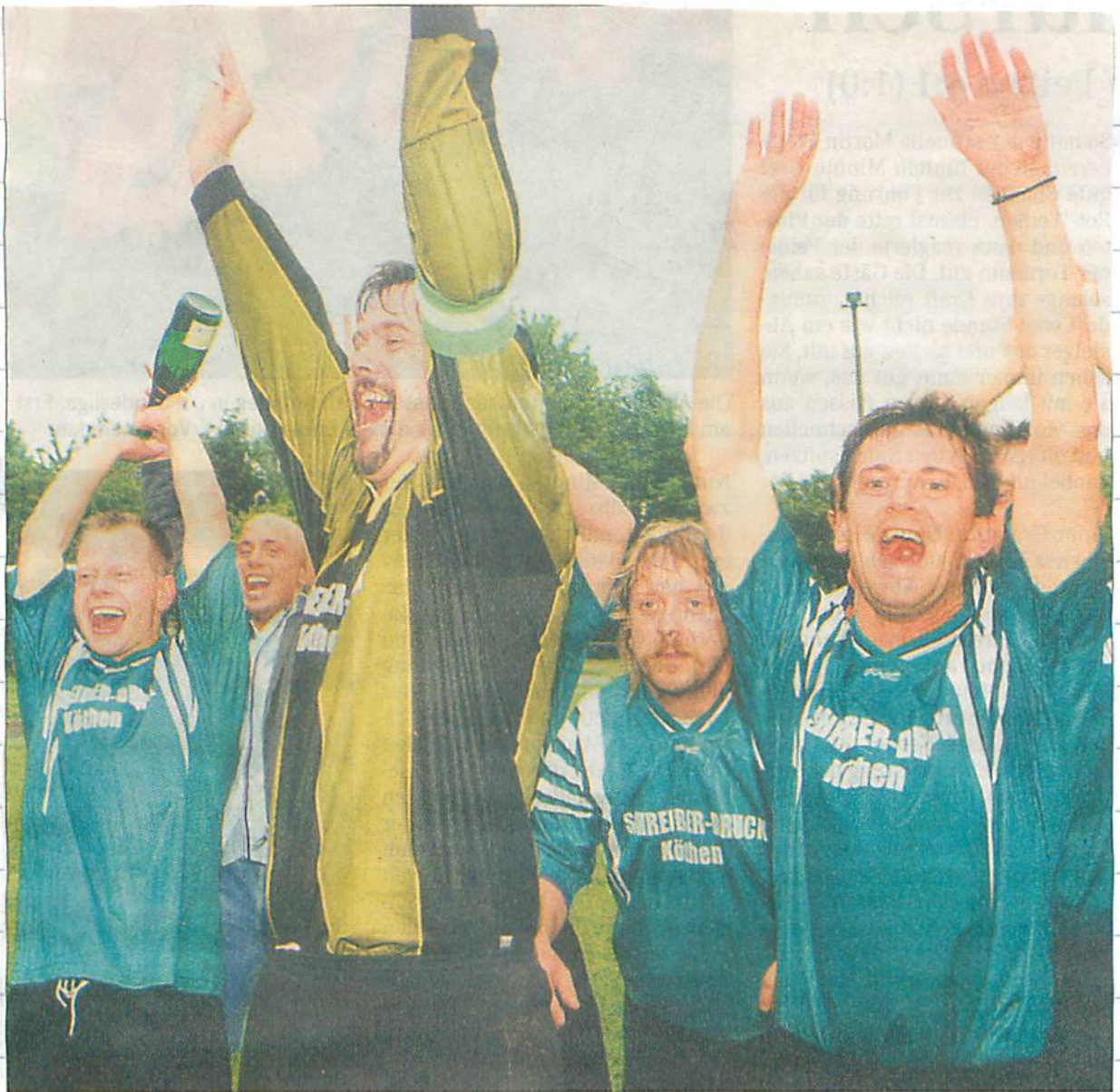
Der Jubel nach dem Abpfiff im letzten Punktspiel kannte bei den Biendorfern keine Grenzen. Der Anspannung beim neuen Kreismeister löste sich mit jedem der fünf Tore beim 5:0 über Neuborna mehr.